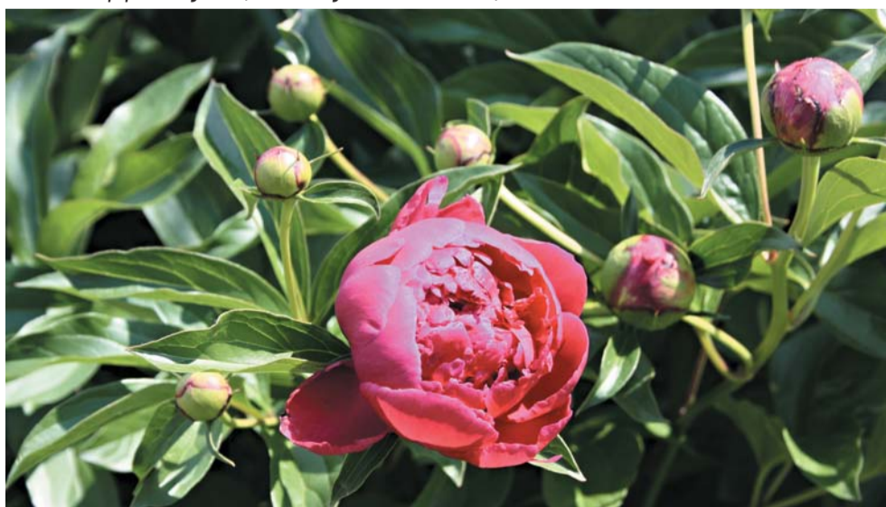
Кошкинский производственный участок