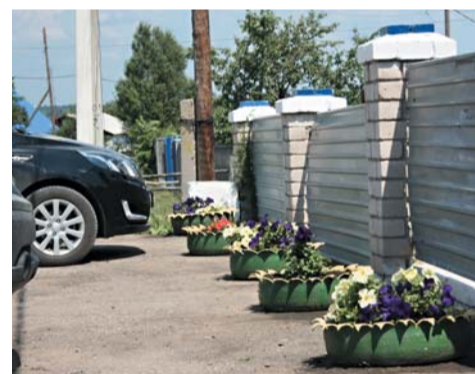
Кошкинский производственный участок